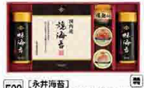
523 〔永井海苔〕 海苔と瓶・缶詰各種結合ギフト 全国産地の海苔を厳選して特選の国内産海苔のりと海苔のり、人気の特選の瓶詰、缶詰の海苔を厳選して仕上げました。海苔、海苔、海苔