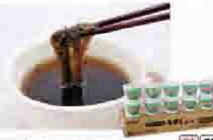
524 〔永井海苔〕 沖縄県産もずくスープ10個セット コラーゲン配合の沖縄県産もずくスープを厳選して仕上げました。もずくスープ(75g×10個) 466mm×308mm×35mm 賞味期限 常温26ヶ月