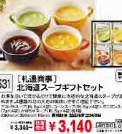
532 〔永井海苔〕 味のりギフト 味のりを厳選して仕上げました。味のりギフト