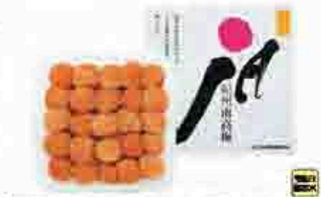
512 〔和歌山県農業協同組合連合会〕 紀州南高梅 甘口はちみつ梅干 紀州南高梅を三層梅とちみつで甘口に仕上げています。甘口はちみつ梅干(水分8%) 450g。208mm×200mm×95mm 賞味期限 常温240日