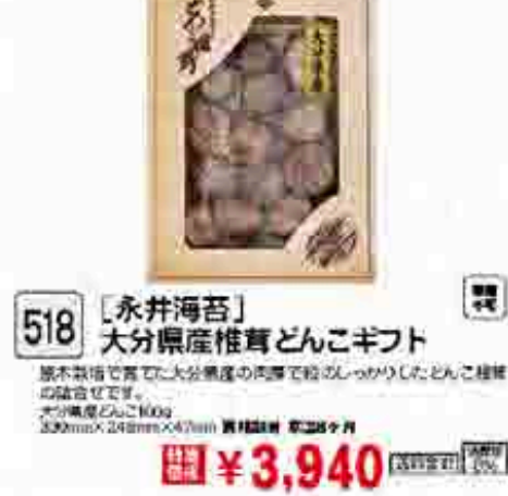
519 〔札幌商社〕 北海道酒のための海のつまみ10種セット 「酒のつまみ」の定番、北海道の海のつまみを厳選して仕上げました。北海道酒のための海のつまみ10種セット