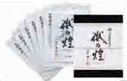
521 〔永井海苔〕 愛知県三河湾産焼のりギフト 愛知県三河湾産の上質海苔を厳選して丁寧に仕上げた焼のりです。各1パック、各1パック、各1パック。焼のり、焼のり、焼のり