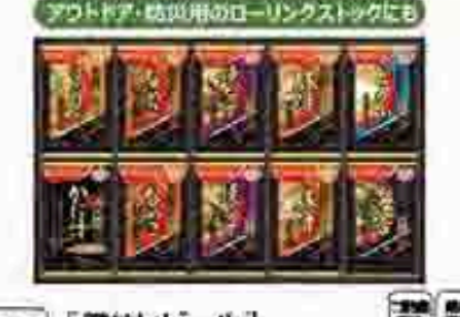
528 〔アサヒビール〕 アミノアースおみそ汁ギフト 商品提供 アサヒビールHD アミノアースおみそ汁を厳選して仕上げました。アミノアースおみそ汁ギフト