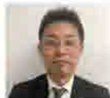
日産神奈川取巻 大出

プリマハム様には、いつも日産車を優先的に導入いただいています。本セールを通じてさらなる関係強化と日産車保有の増大に繋がるよう、皆さまのご支援をお願い致します。