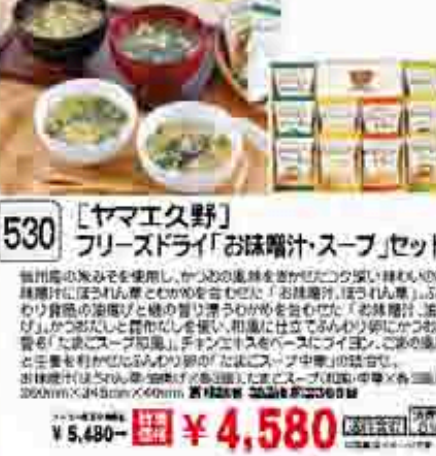
531 〔札幌商社〕 北海道スープギフトセット 北海道のスープを厳選して仕上げました。北海道スープギフトセット