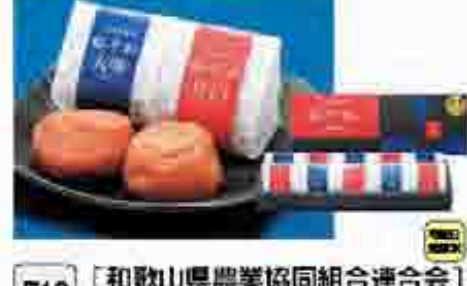
516 〔和歌山県農業協同組合連合会〕 紀州南高梅 梅市松 収穫量の限られたA級サイズの梅干を厳選し、人気の調味料に漬込みました。梅市松(水分8%) 450g。208mm×200mm×95mm 賞味期限 常温240日