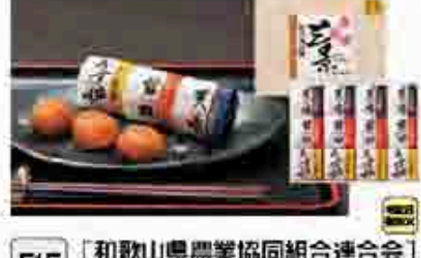
515 〔和歌山県農業協同組合連合会〕 紀州南高梅 三景12粒 紀州南高梅の甘口はちみつ、天味、(てんまい)、うす塩味梅干の3種類の梅干を厳選して仕上げました。三景12粒(水分8%) 450g。208mm×200mm×95mm 賞味期限 常温240日