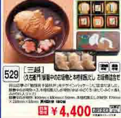
530 〔ヤマエ久野〕 フリーズドライ「お味汁・スープ」セット お味汁、スープを厳選して仕上げました。お味汁・スープセット