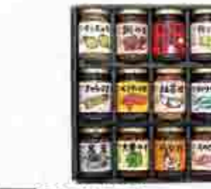
511 〔東洋水産〕 酒悦 名菓美点B 山の幸、海の幸、海産物の味を堪能しながら味わう、酒悦名菓美点Bの味は、江戸産品の味を堪能していただけます。酒悦名菓美点Bの味は、江戸産品の味を堪能していただけます。酒悦名菓美点Bの味は、江戸産品の味を堪能していただけます。