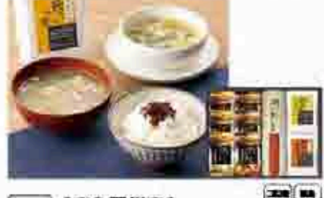
526 〔京急百貨店〕 くにんべん・柳屋本店無刺し海・スープギフト おきかたのくにんべんを厳選して仕上げました。くにんべん、海、スープ