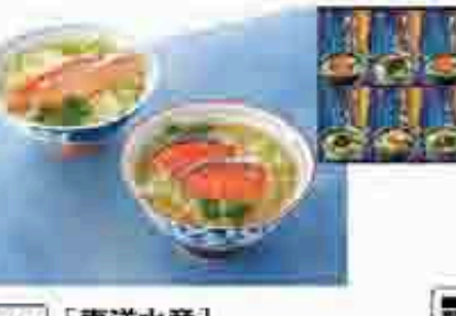
525 〔東洋水産〕 酒悦 冷やし茶漬ごのみ 夏の暑い日に、冷やしたての酒悦冷やし茶漬ごのみ。酒悦冷やし茶漬ごのみ(水分8%) 450g。208mm×200mm×95mm 賞味期限 常温240日