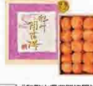
517 〔和歌山県農業協同組合連合会〕 紀州南高梅 うす塩味梅干木箱 紀州南高梅を塩漬けし、軽塩味とうす塩味の調味料に漬込みました。うす塩味梅干(水分8%) 200g×4個入り。180mm×108mm×20mm 賞味期限 常温240日