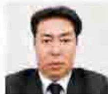
日産自動車販売 中上

ティーネットジャパン様には長きに渡り日産車をご愛用いただいております。是非商品のご購入をいただけますようお願いいたします。