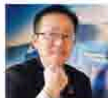
キャラバンコーヒー 砂子課

キャラバンコーヒー様も日産も横浜で誕生。ユニマツキャラバン様は日産車を多く保有いただいています。私が自信をもってお勧めする美味しいコーヒーを是非ご賞味ください!