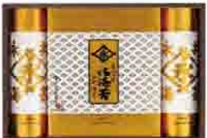
522 〔永井海苔〕 海苔結合ギフト 国内産の上質海苔のりと特製タレで仕上げた味のりの結合ギフトです。味のり、味のり、味のり。味のり、味のり、味のり