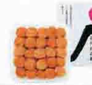
514 〔和歌山県農業協同組合連合会〕 紀州南高梅 天味 紀州南高梅を塩漬けし、軽塩味とうす塩味の調味料に漬込みました。天味梅干(水分8%) 450g。208mm×200mm×95mm 賞味期限 常温240日