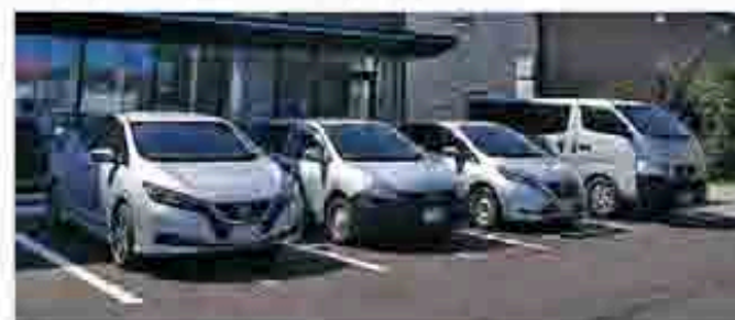
石川に配備されている日産車ラインアップ

引き続きサントリーグループの商品をご愛顧いただけますよう、よろしくお願い申し上げます。