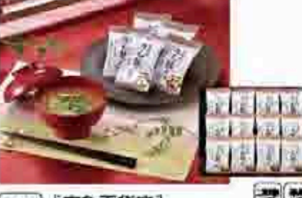
527 〔京急百貨店〕 たん熊北店フリーズドライセット 熊、魚などの魚類を厳選して仕上げました。たん熊北店フリーズドライセット