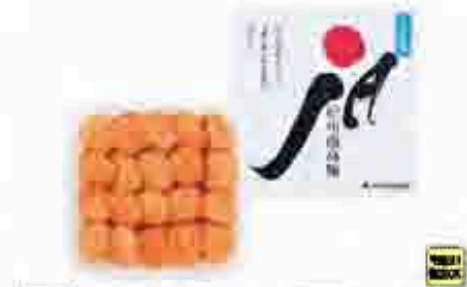
513 〔和歌山県農業協同組合連合会〕 紀州南高梅 うす塩味梅干 紀州南高梅を塩漬けし、軽塩味とうす塩味の調味料に漬込みました。うす塩味梅干(水分8%) 450g。208mm×200mm×95mm 賞味期限 常温240日