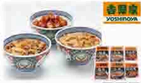
509 〔京急百貨店〕 吉野家いろいろ丼セット 吉野家が目指してきた味は、しっかりと。まるややかなタレの豚で、しつこく出た吉野家秘伝の味をご家庭でお楽しみください。牛丼の身120g×2、豚丼の身120g×2、味噌汁180g×2、漬物、漬物汁