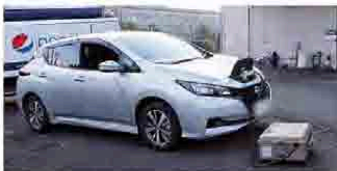
個別に配備されているBCP対策のリーフ(リーフームーバーに接続し給電中)

(スコットランド、アイルランド、カナダ、アメリカ、日本)のウイスキーをブレンドした逸品です。それぞれの地域の特性を活かしたウイスキーが融合し、豊かな果実の味わいとスパイ