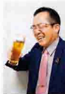
弊所外で撮影しています

是非、従業員の皆さまご自身のご褒美に、友人やご両親、ご親戚の方へのプレゼントとして、サントリー商品をご購入ください！