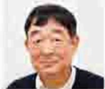
日産神奈川販売 亀塚

フリーデン様には、日産車を多く導入していただいております。本セールを通じて今まで以上の関係を築き、日産車の拡販に繋がるよう、皆様のご協力、ご支援をお願いいたします。