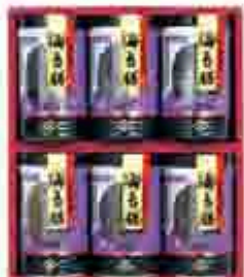
520 〔永井海苔〕 味のりセット ひと味違う上塗りタイプ修行海苔、有明海産の海苔を厳選し、永井海苔特製タレを上塗りに仕上げました。味のりセット。味のり、味のり、味のり