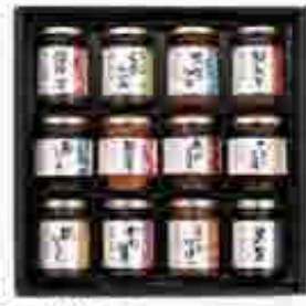
510 〔東洋水産〕 酒悦 山海探幸B 江戸エディブルの山と海の特産品を厳選し、江戸産品の酒悦山海探幸Bの味は、江戸産品の味を堪能していただけます。酒悦山海探幸Bの味は、江戸産品の味を堪能していただけます。酒悦山海探幸Bの味は、江戸産品の味を堪能していただけます。